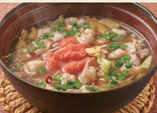
31 明太もつ鍋のおうどん 1,980 Beef Offal, Spicy Pollock Roe Udon