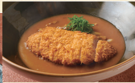
37 かつカレーのおうどん 1,680 Pork Cutlet Curry Udon