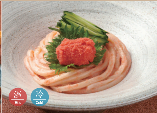
34 明太子のおうどん 1,480 Spicy Pollock Roe Udon