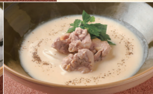
41 鶏クリームのおうどん 1,580 Creamy Chicken Udon