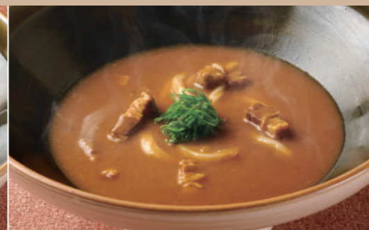
36 秘伝 カレーのおうどん 1,180 Special Recipe Curry Udon