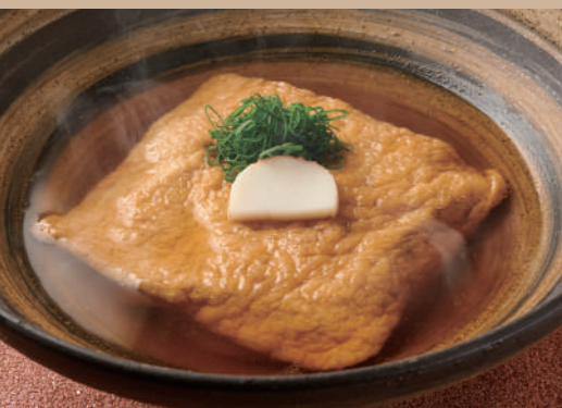
29 大判 きつねのおうどん 980 Large Sweet Fried Tofu Kitsune Udon