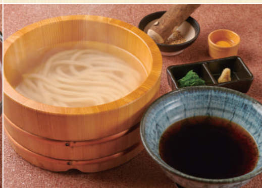
32 釜あげのおうどん 980 Hot Dipping Kama-Age Udon