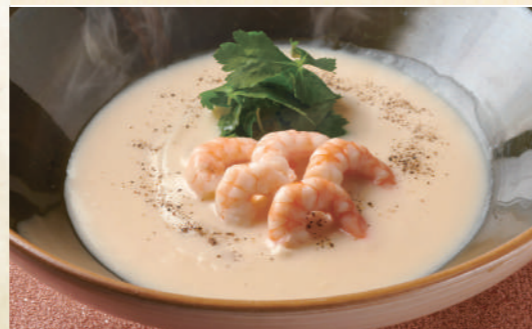
42 海老クリームのおうどん 1,580 Creamy Prawn Udon