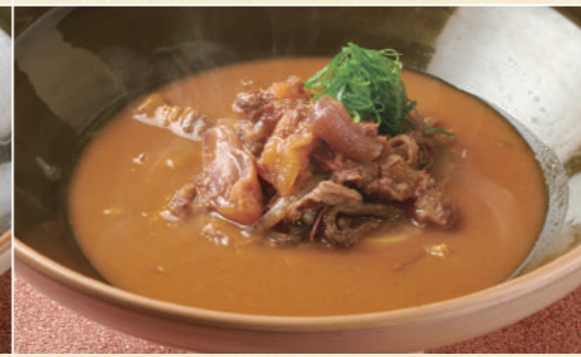
38 牛すじカレーのおうどん 1,580 Beef Tendon Curry Udon