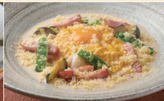
43 カルボナーラのおうどん 1,680 Carbonara Udon