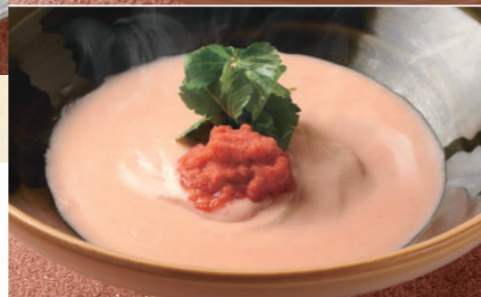
40 明太子クリームのおうどん 1,580 Creamy Spicy Pollock Roe Udon