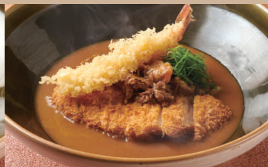
35 カレー三味のおうどん 2,280 Deluxe Curry Zanmai Udon