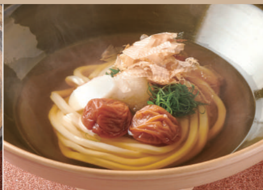
30 紀州南高梅 梅干のおうどん 1,180 Kishu Nanko Pickled Plum Umeboshi Udon