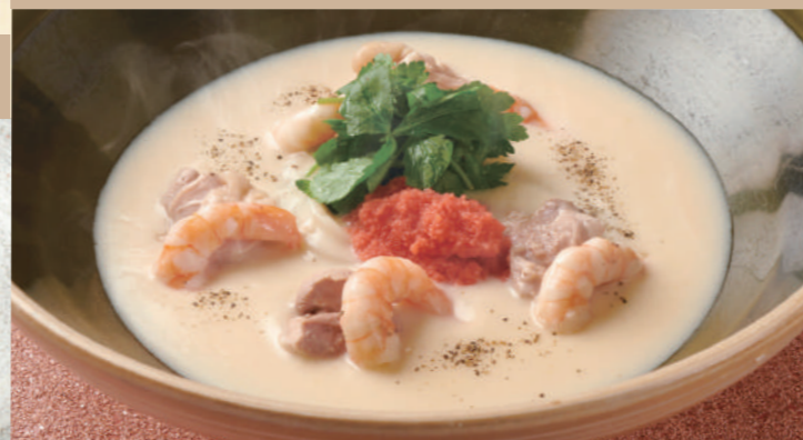
39 海老、鶏肉、明太子 クリーム三味の おうどん 2,280 Creamy Prawn, Chicken and Spicy Pollock Roe Udon