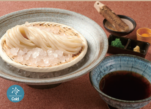
33 ざるのおうどん 980 Cold Dipping Zaru Udon