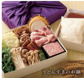
うどんすきのお鍋