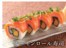
サーモンロール寿司